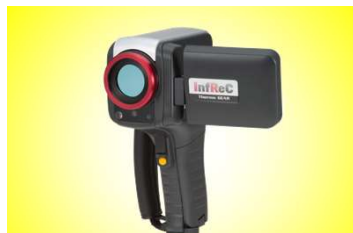
G100シリーズ メーカー希望小売価格68万円(税別)～