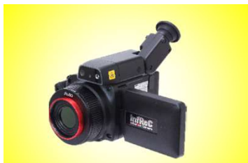
R450シリーズ メーカー希望小売価格130万円(税別)～