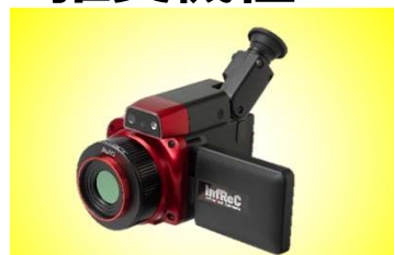
R550シリーズ メーカー希望小売価格190万円(税別)～